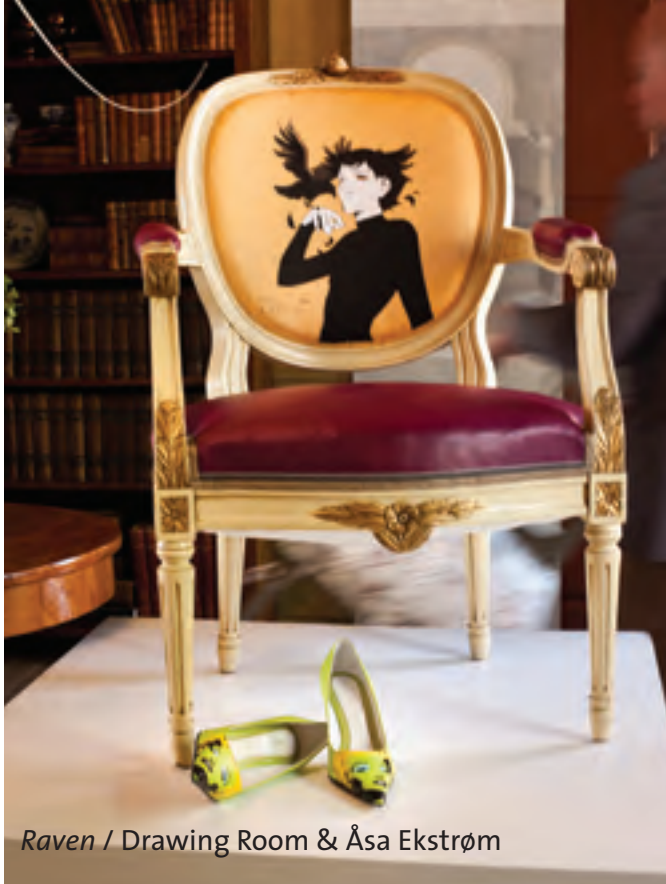
Raven / Drawing Room & Åsa Ekstrøm