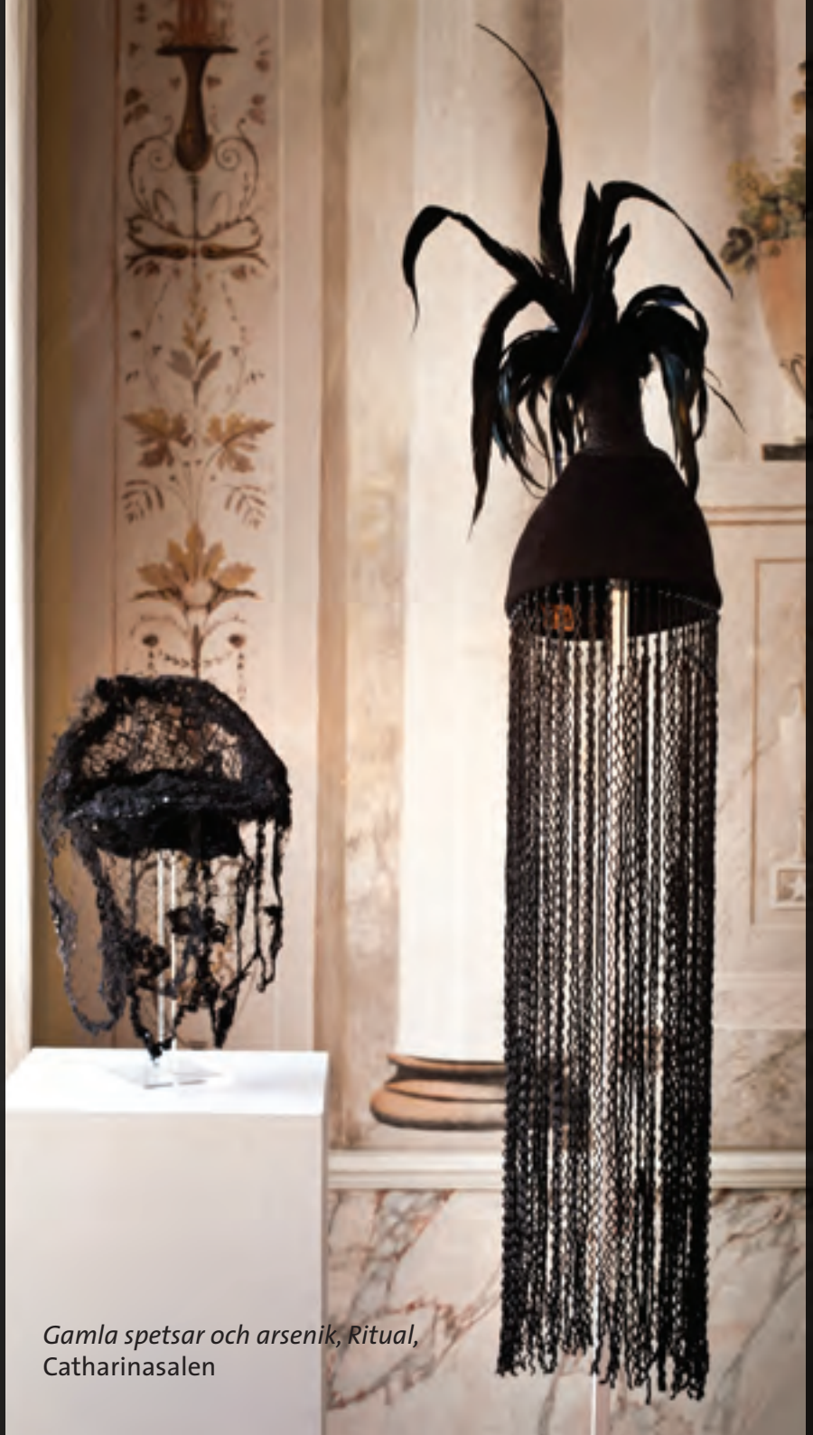
Gamla spetsar och arsenik, Ritual, Catharinasalen

Almost all of the rooms on the ground floor of the corps de logi have ceiling and wall paintings. As much skill and elegance that was shown by the dec-