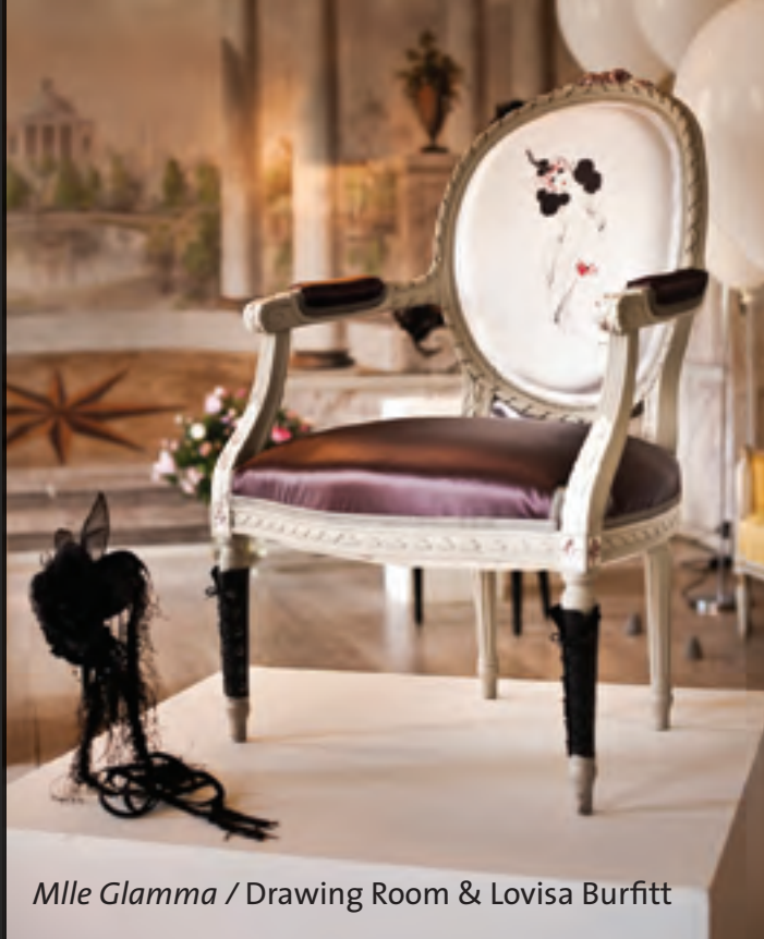
Mlle Glamma / Drawing Room & Lovisa Burfitt