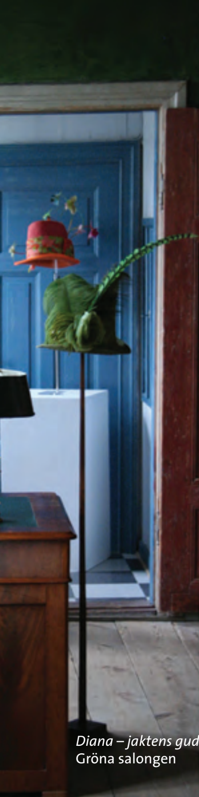
Diana – jaktens gudinna, Gröna salongen