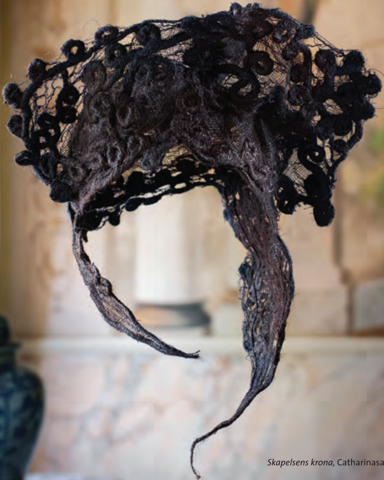
Skapelsens krona, Catharinasalen