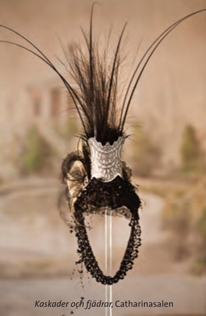
Kaskader och fjädrar, Catharinasalen