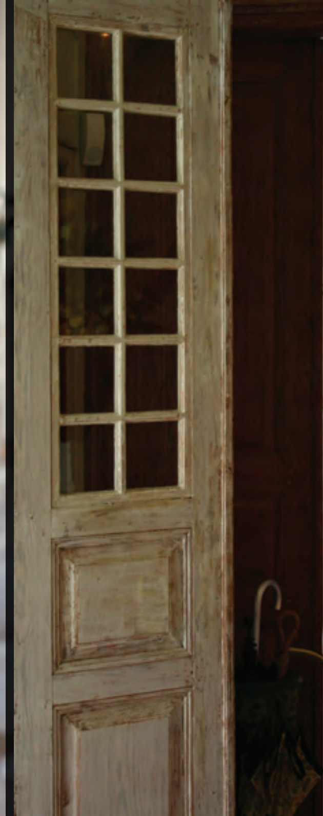
Fantomen på operaen och Gustav III, Catharinasalen