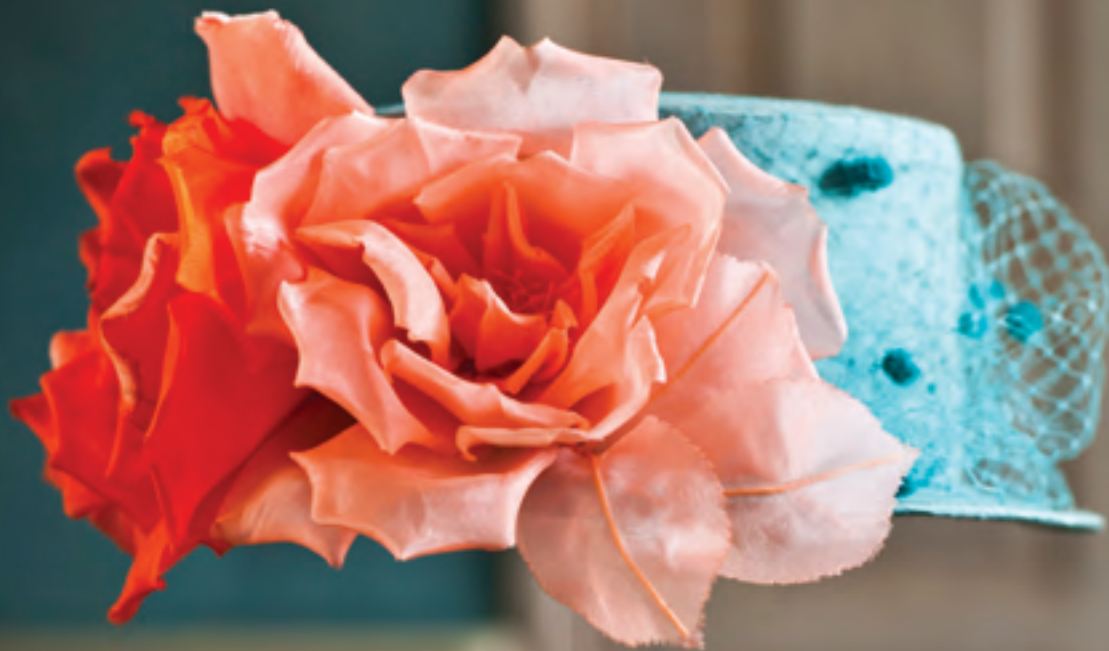
Svärmors dröm, Förmaket

Huvudbyggnadens välbevarade interiörer visar högsta inredningsmode i det tidiga 1800- talets Sverige med influenser från Frankrike, England och Tyskland.