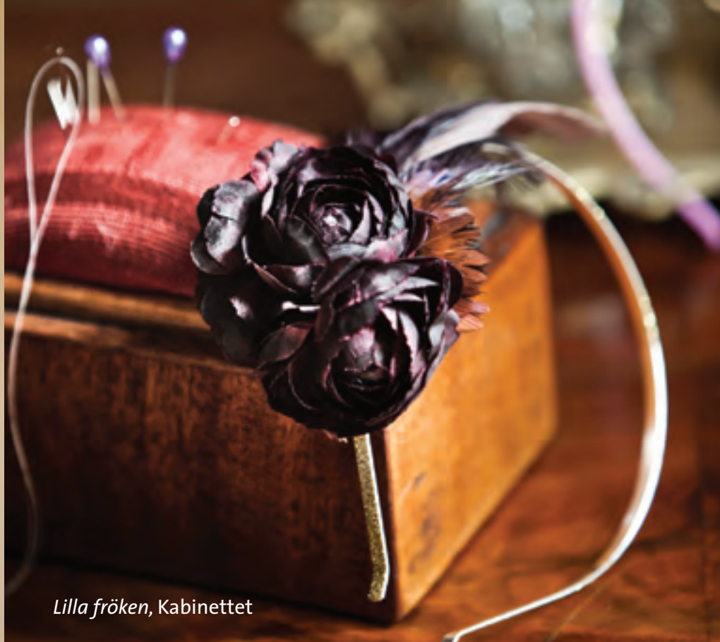
Lilla fröken, Kabinettet