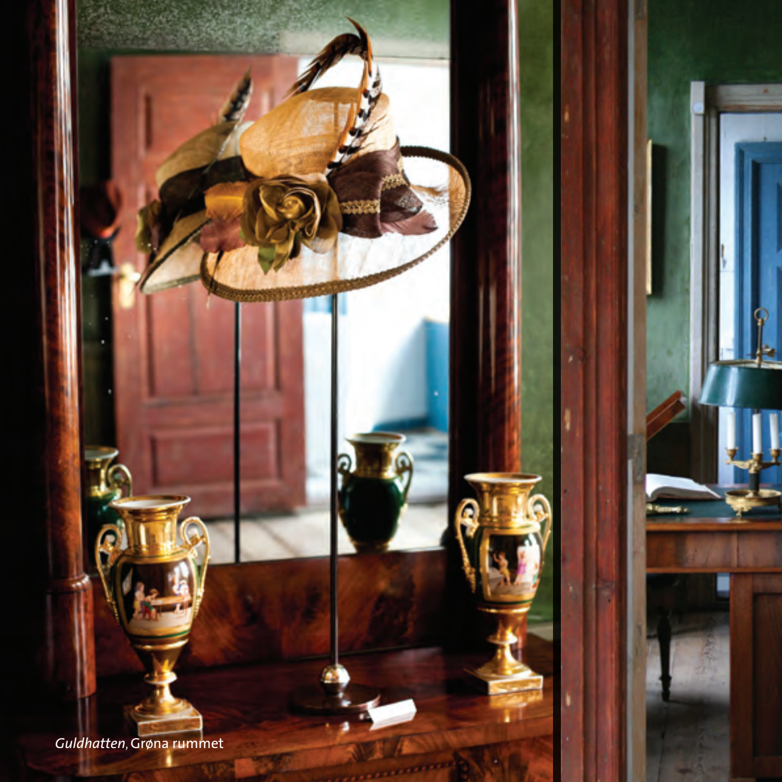
Guldhatten, Grøna rummet