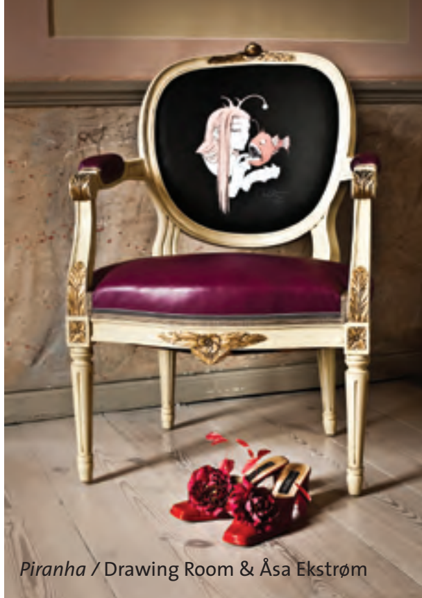
Piranha / Drawing Room & Åsa Ekstrøm