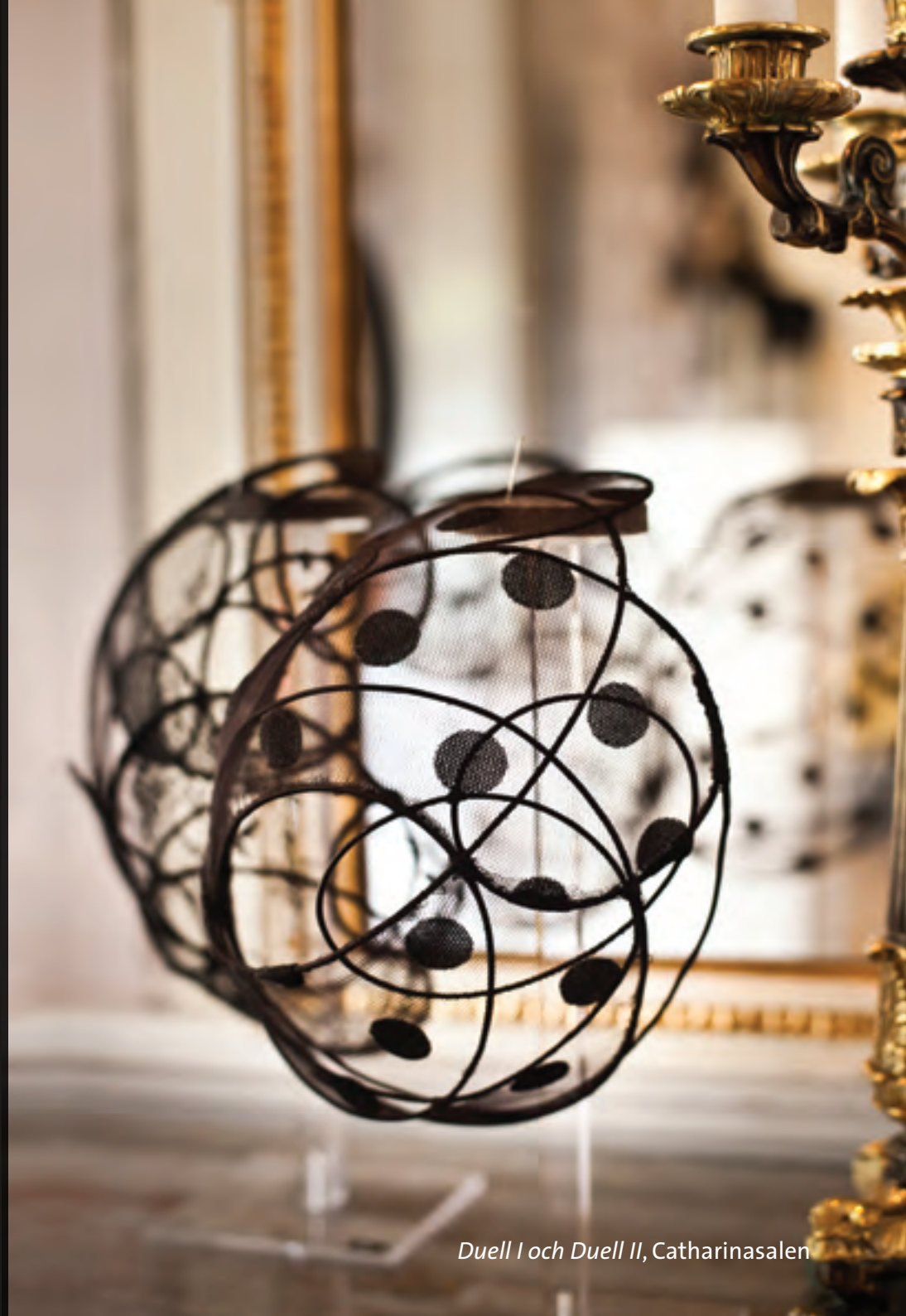
Duell I och Duell II, Catharinasalen