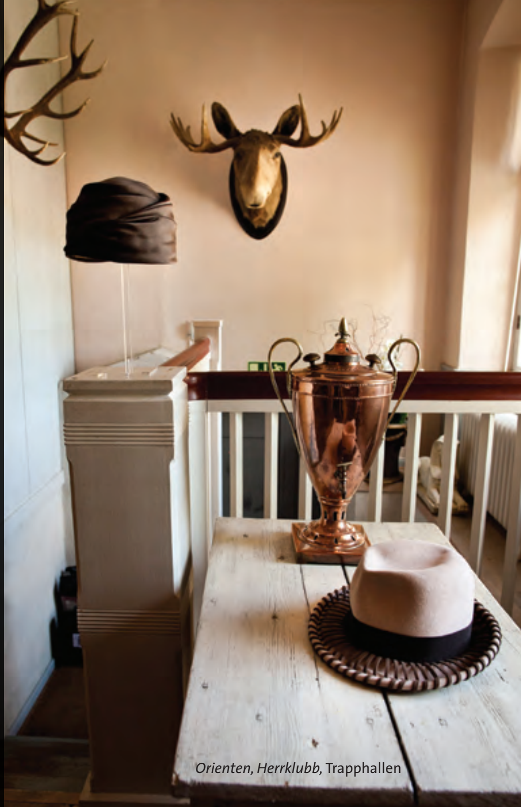
Orienten, Herrklubb, Trapphallen