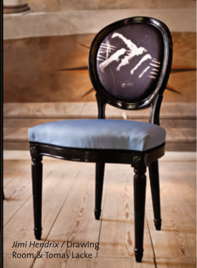
Jimi Hendrix / Drawing Room & Tomas Lacke